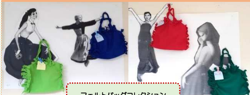
フェルトバッグコレクション