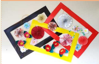
椿咲き、冬仕様。(廊下)