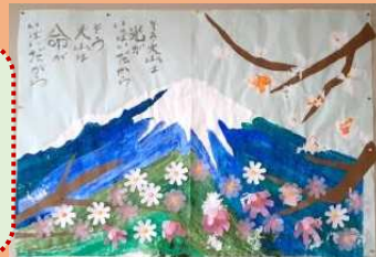
和室には、水彩画教室の作品。季節の花が移り変わります。