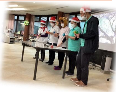
ハンドベル「赤鼻のトナカイ」

令和6年12月24日(火)～26日(木)に日頃の感謝を込めて、「デイサービスだいせん感謝祭」を開催しました。米寿の方のお祝いをはじめ、普段からデイサービスを利用されている皆様に向けて、職員によるハンドベル演奏やドジョウ掬いのパフォーマンスを披露しました。 最後はスライドショーで、「今年は、いっぱい色々楽しい事があったな～」と、一年の思い出をしみじみと振り返りました。