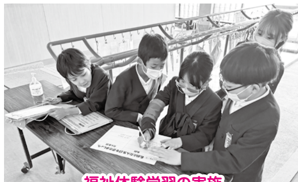
福祉体験学習の実施