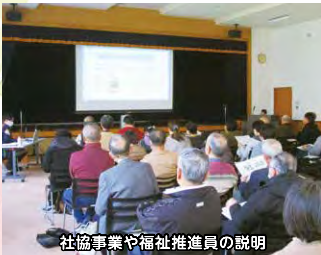
社協事業や福祉推進員の説明

大山町社会福祉協議会では、町内各集落に福祉のまちづくりの推進役として福祉推進員の選出をお願いしています。地域で気になる方への見守りや声掛け、ふれあいいきいきサロン活動の推進などが主な役割です。1月から新たに選出された集落もあることから、福祉推進員を対象に研修会を開催しました。