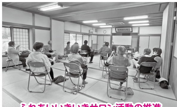
ふれあいいきいきサロン活動の推進